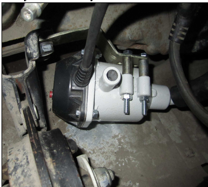
Рис.2. Способ крепления №2.