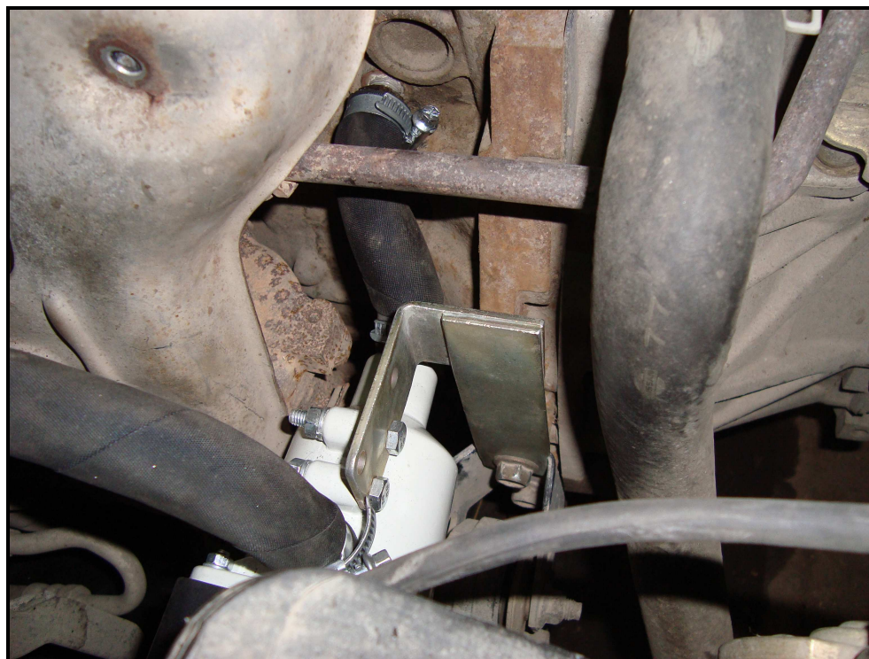
Рис.2. Монтаж кронштейна с электроподогревателем, штуцера К1/4", Входного и выходного рукава.