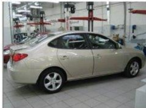
Φοτο № 16