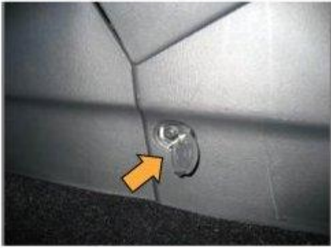
Φοτο № 9