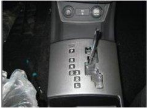
Φοτο Νο 3