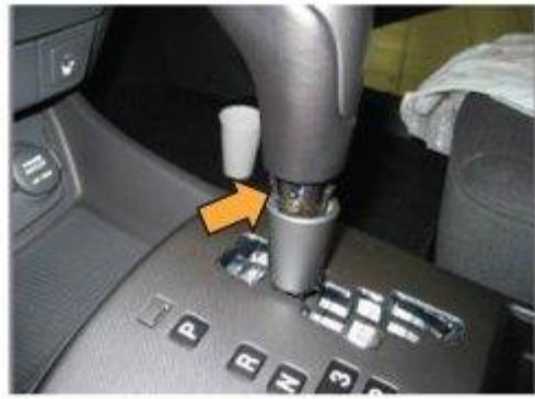
Φοτο Νο 2