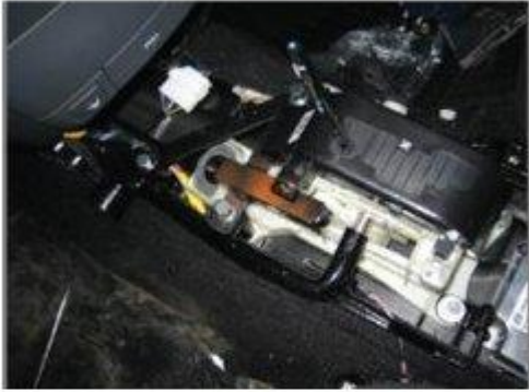
Φοτο № 11