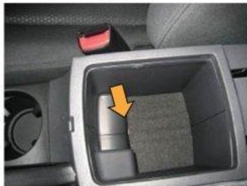
Φοτο Νο 6