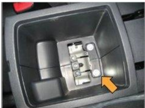
Φοτο Νο 7