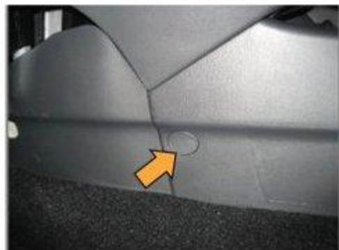
Φοτο Νο 8