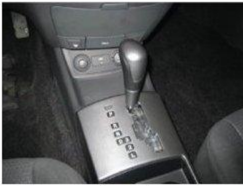
Φοτο Νο 1