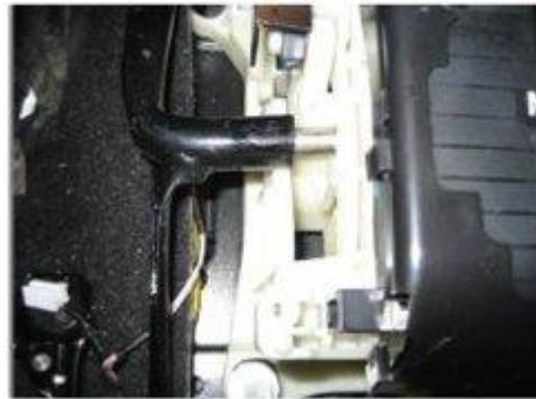
Φοτο № 14