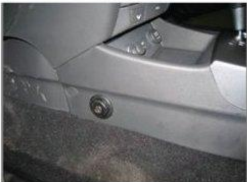
Φοτο № 15