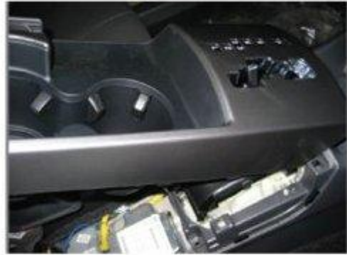
Φοτο Νο 4