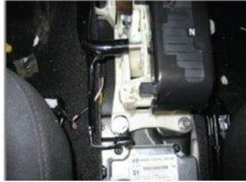
Φοτο № 12