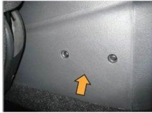
Φοτο № 10