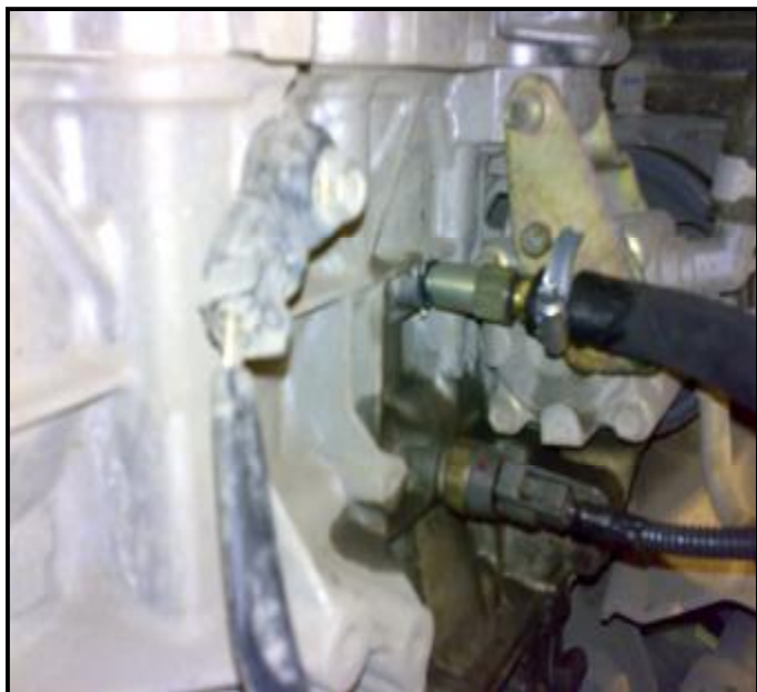
Рис. 1 Положение удлинителя и штуцера