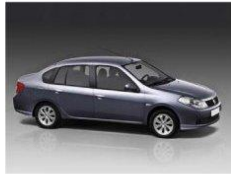
Renault Symbol 2008-