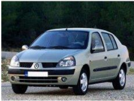
Renault Symbol 2006-2008