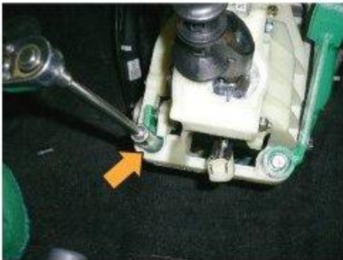
Φοτο № 15