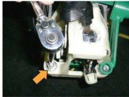
Φοτο № 14