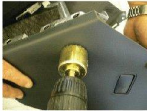
Φοτο № 20