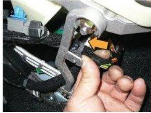
Φοτο № 12