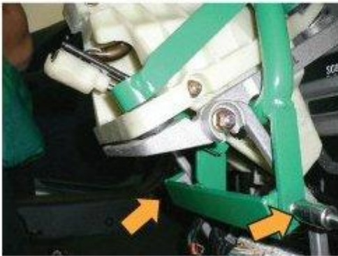
Φοτο № 13