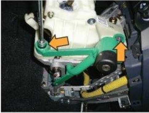
Φοτο № 11