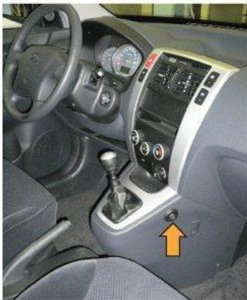
Φοτο № 21