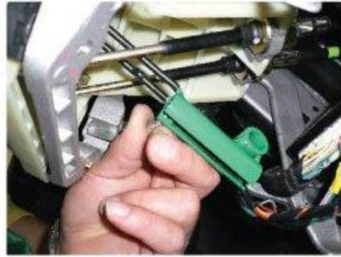
Φοτο № 10