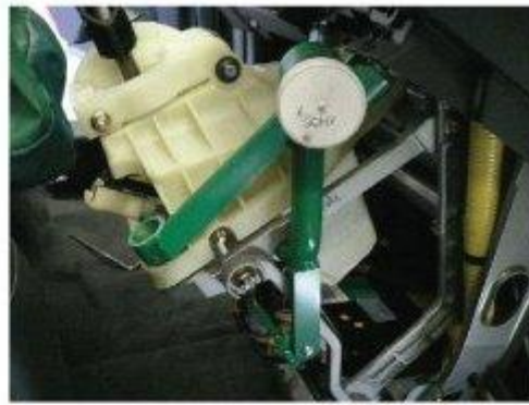
Φοτο № 18