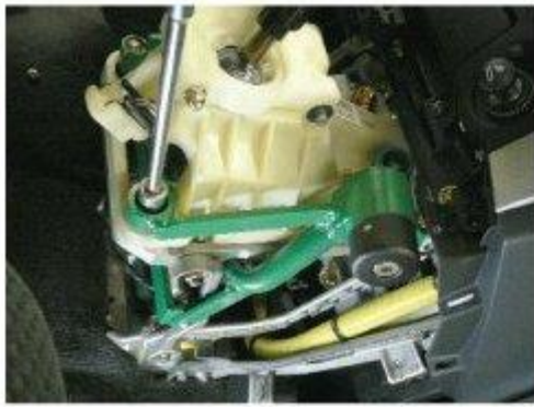
Φοτο № 17