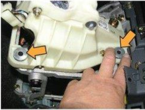
Φοτο № 9