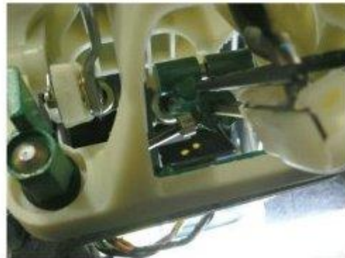
Φοτο № 16