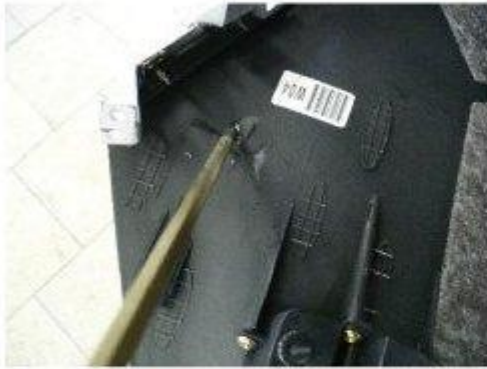
Φοτο № 19