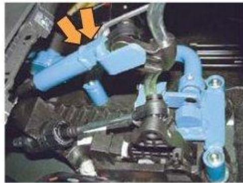
Φοτο № 14