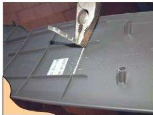
Φοτο № 16