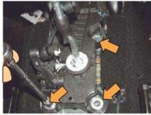
Φοτο № 10