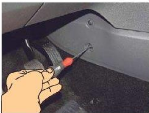
Φοτο № 1