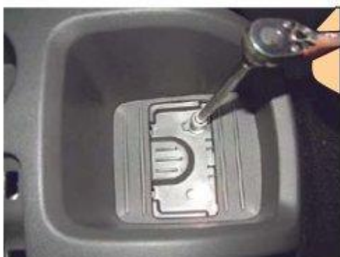
Φοτο № 7