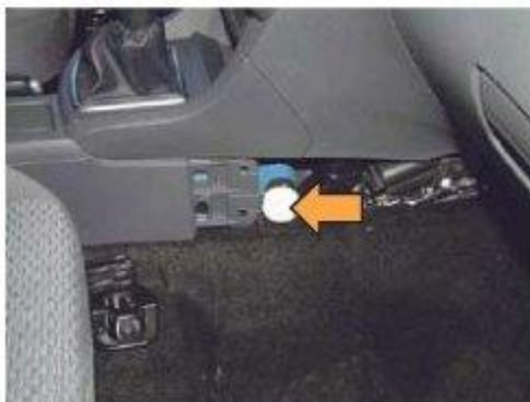
Φοτο № 15