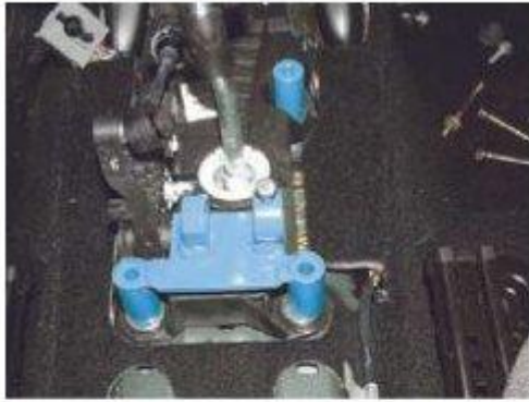
Φοτο № 11