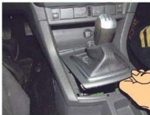
Φοτο № 4