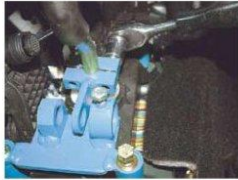
Φοτο № 12