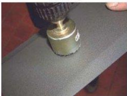
Фото № 19