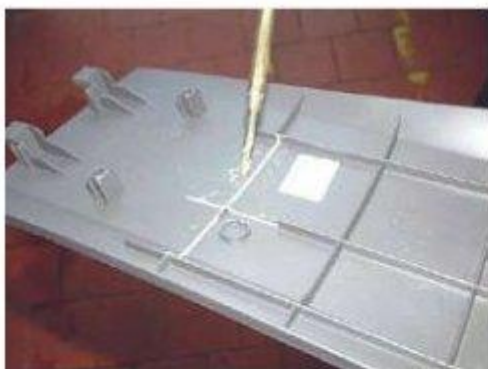
Фото № 17