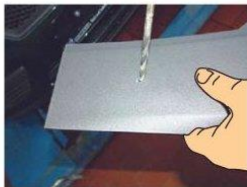
Фото № 18