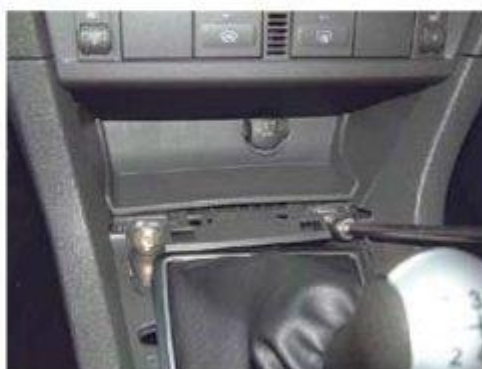
Φοτο № 8