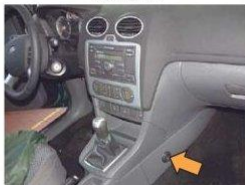
Фото № 20