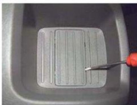
Φοτο № 6