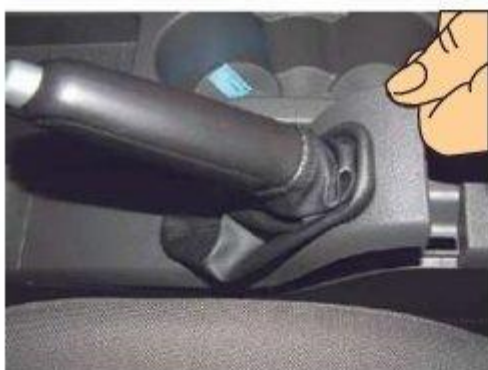
Φοτο № 5