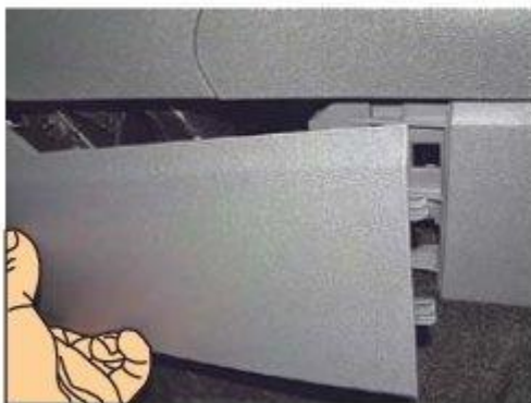
Φοτο № 3