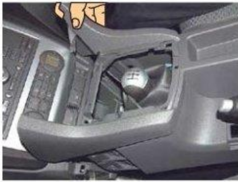
Φοτο № 9