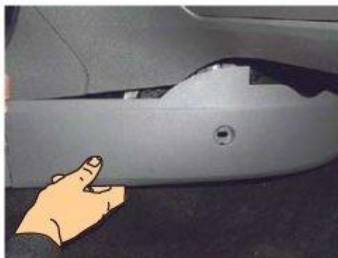
Φοτο № 2