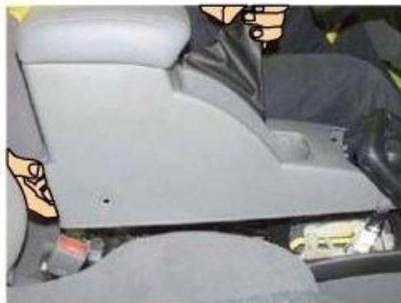
Φοτο Νο 2