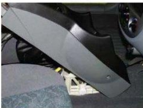
Φοτο Νο 5