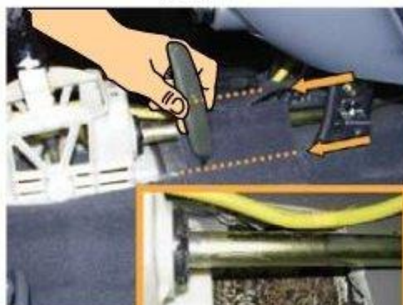
Φοτο Νο 6