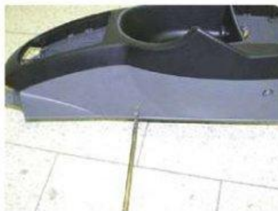
Φοτο № 16