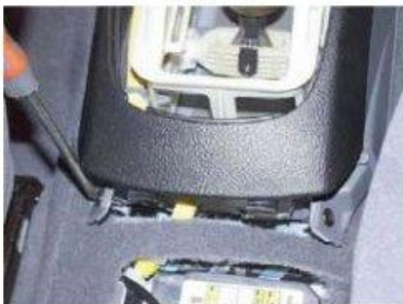
Φοτο Νο 3