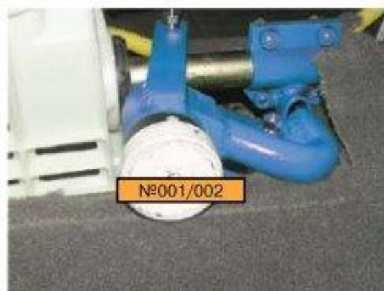
Φοτο № 14