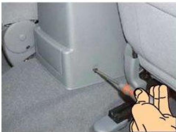
Φοτο Νο 1