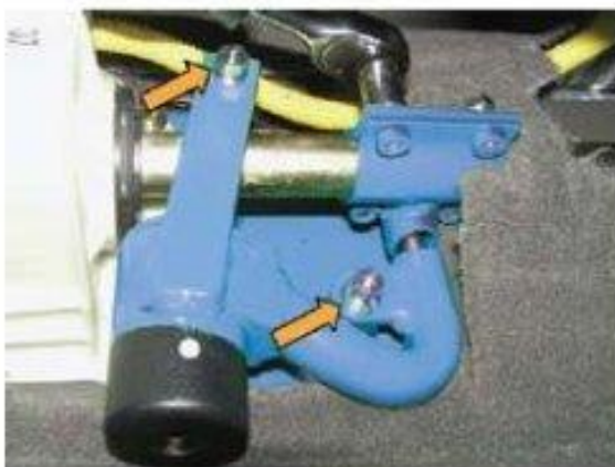
Φοτο № 11