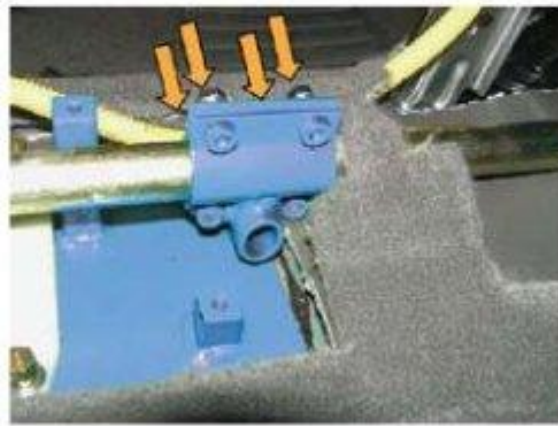
Φοτο № 10