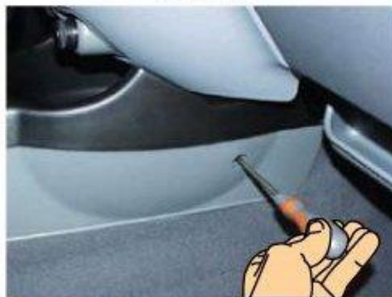
Φοτο Νο 4