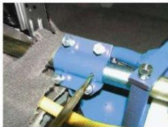
Φοτο № 12