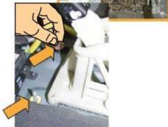
Φοτο Νο 8