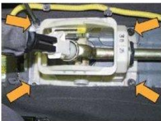
Φοτο Νο 7