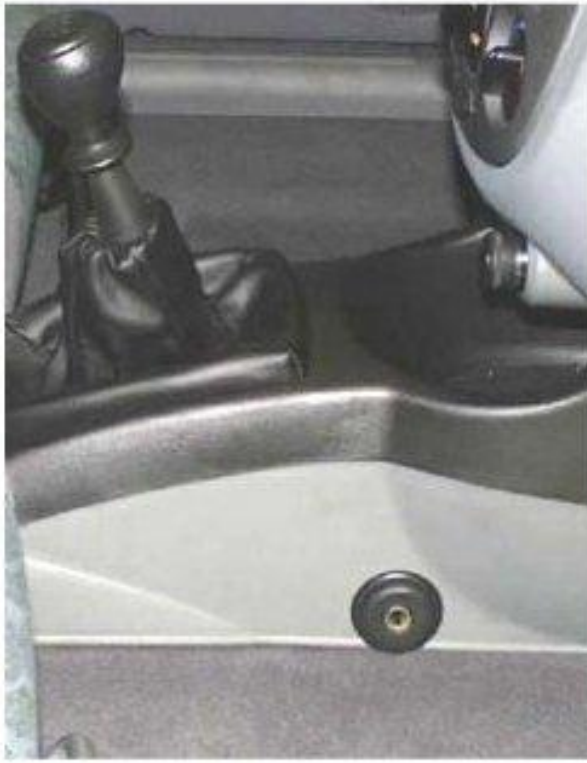
Φοτο Νº 17