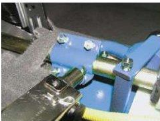
Φοτο № 13