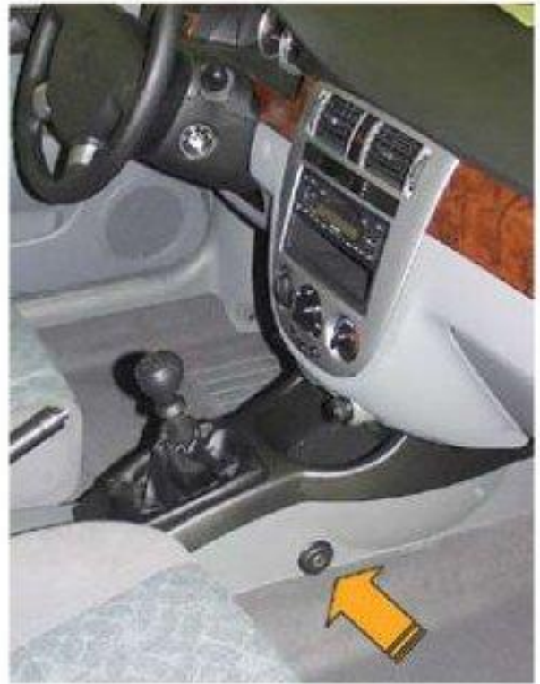
Φοτο Νº 18